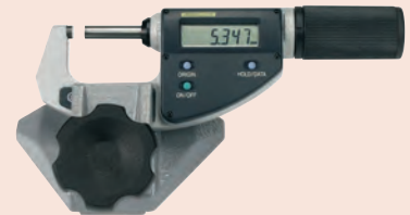
293-666 rögzítő eszközzel 156-105-10 (opcionális tartozék)