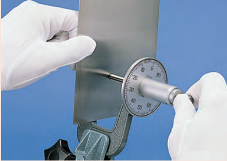
Sorozat 119 mérőórával az egyszerű és gyors leolvasás érdekében.