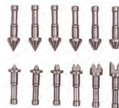
Cserélhető ülék/orsóbetét párok